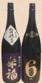
(右) ナンバー6 (左) 来福

花酵母というとても華やかな香りを上品に出す酒です。しっかりとしたコクとふくよかて綺麗な米の旨み特徴。